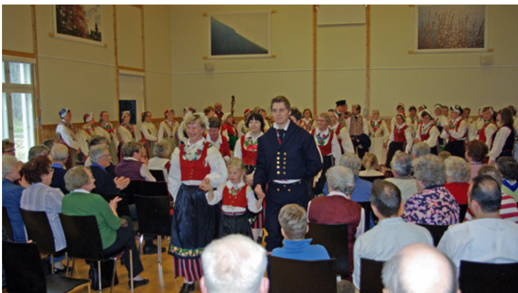
Folkdräktsprojektets avslutningsfest i Iniö 27.4.2008